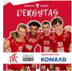
Einheitlicher Auftritt: Treffer & TVK-Spieltag-Posts

Trotzdem ist das Treffer-Team offen für Änder